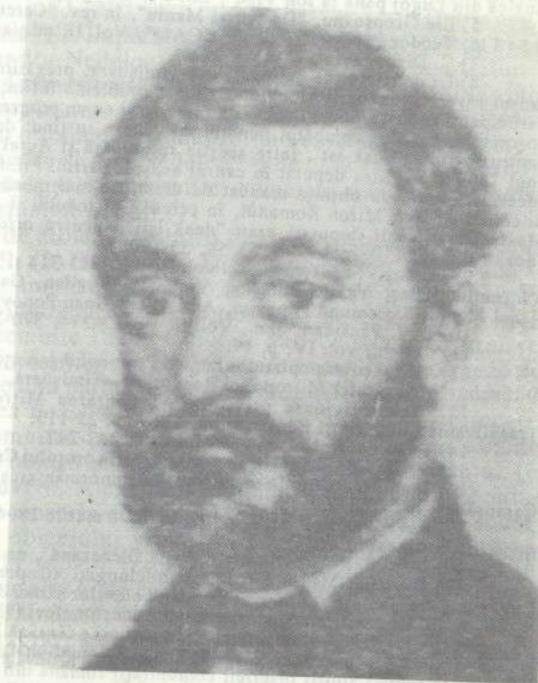
Dr. AUREL MANIU

În anul 1870 a fost numit consilier la Tabla regească din Pesta, post pe care nu l-a ocupat, fiind trimis în misiune diplomatică. Din relatările unor contemporani reiese că el a fost acela "...prin a cărui tact și prudență s-au legat convențiile cu Țara Românească ale monarhiei austro-ungare" (16).